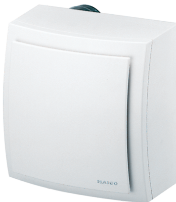
Radial-Dachventilator GRD inkl. Druckregelung