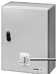
ATL-Schaltschrank mit Lastteil