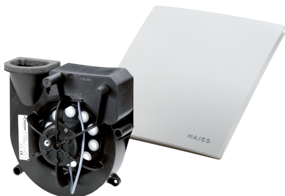
Boîtier encastré ER-UP..