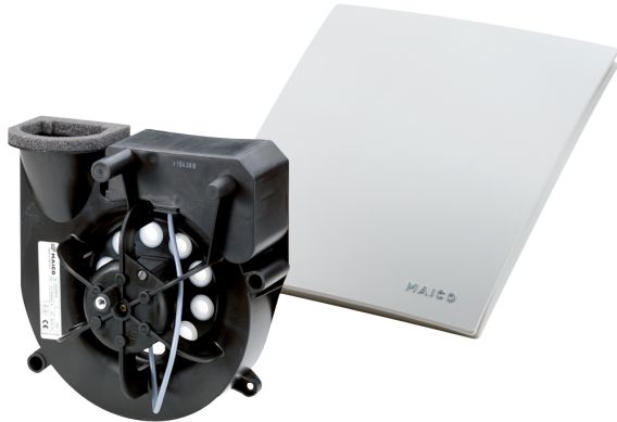
Boîtier encastré ER-UP..