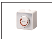
variateur de vitesse ST 1