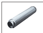
amortisseur de bruit RSR