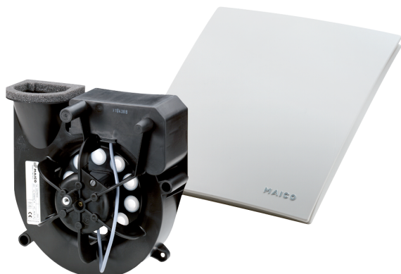
Obudowa podtynkowa ER-UP..