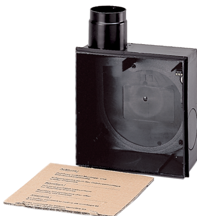
Элемент вытяжной вентиляции для настенного монтажа с настенным корпусом