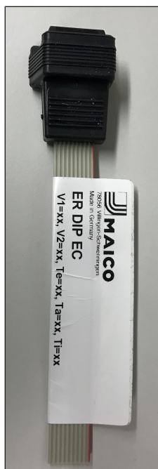
Dongle ER DIP EC